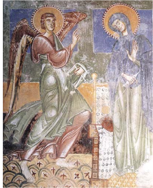
▲ Anunciación. Pinturas murales de Castel Appiano, Bolzano (Italia), c. 1200.