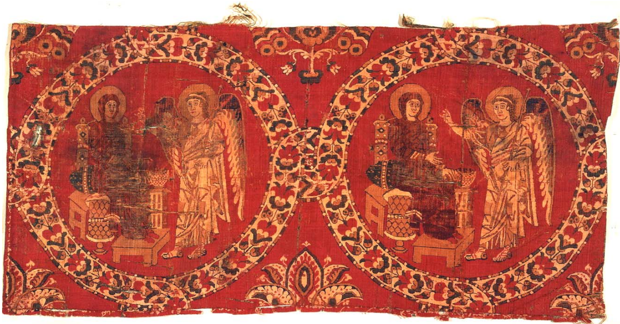
▲ Anunciación. Samito de seda, siglos VIII-IX. Ciudad del Vaticano, Museos Vaticanos.

http://images.metmuseum.org/CRDImages/cl/web-large/isl642c.jpg [captura 10/7/2013]