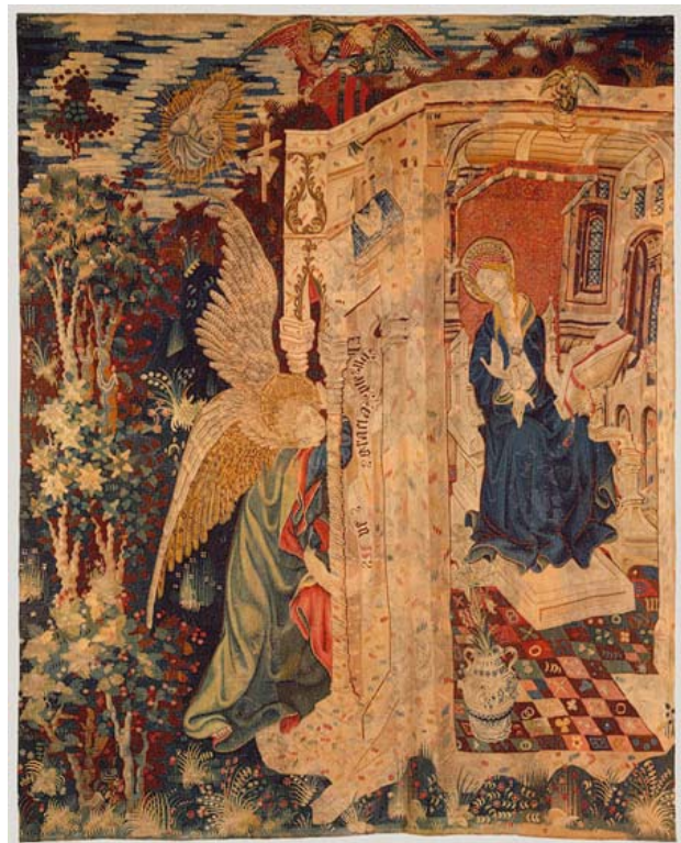
Tapiz con la Anunciación, Arras (Francia), c. 1410-1430, lana e hilos metálicos. Nueva York, The Metropolitan Museum of Art.

http://www.wga.hu/art/b/broederl/02left1.jpg [captura 10/7/2013]