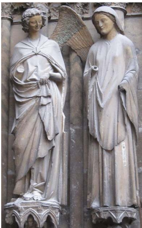
◀ Anunciación. Jambas de la portada central de la fachada occidental de la catedral de Reims (Francia), c. 1230-1260.

http://employees.oneonta.edu/farberas/arth/Images/arth212images/gothic/Reims/sculpture/annunciation.jpg [captura 10/7/2013]