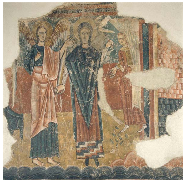
◀ Icono de la Anunciación. Constantinopla, finales del siglo XII. Monasterio de Santa Catalina del Sinaí (Egipto).

http://images.icon-art.info/main/03200-03299/03271.jpg [captura 10/7/2013]