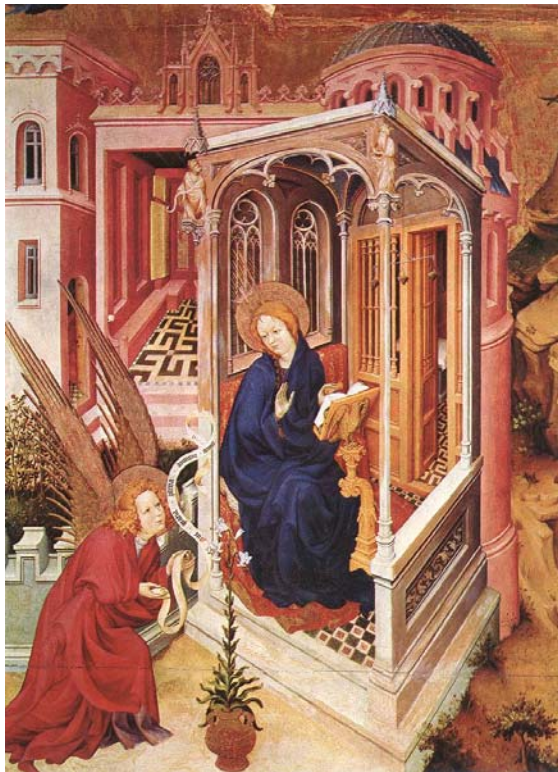
Melchior Broederlam, Retablo de la Cartuja de Champmol, Dijon (Francia), c. 1393-1399, temple sobre tabla, detalle. Dijon, Musée des Beaux-Arts.

http://www.wga.hu/art/b/broederl/02left1.jpg [captura 10/7/2013]