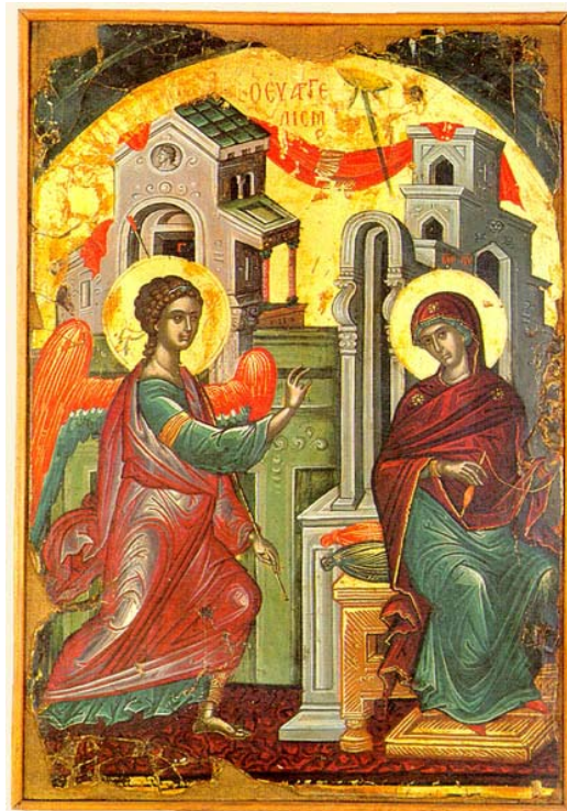
Teófanos de Creta, Anunciación , 1546, temple sobre tabla. Monte Athos (Grecia), monasterio Stavronikita.