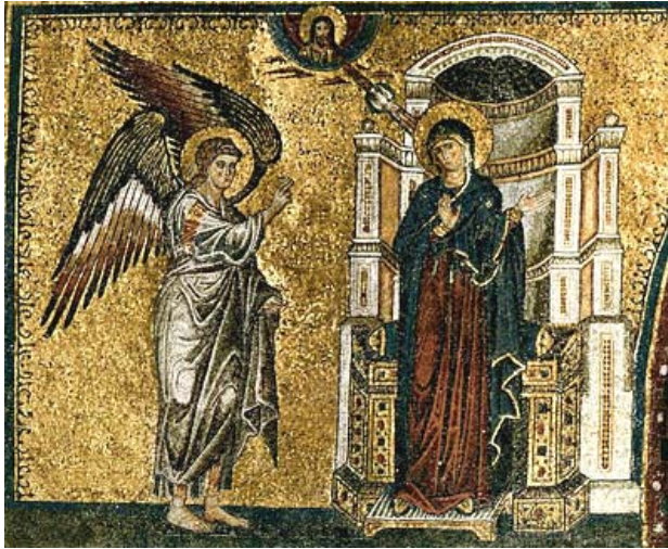
▲ Jacopo Torriti, Anunciación . Mosaicos del ábside de Santa Maria Maggiore de Roma (Italia), c. 1295.