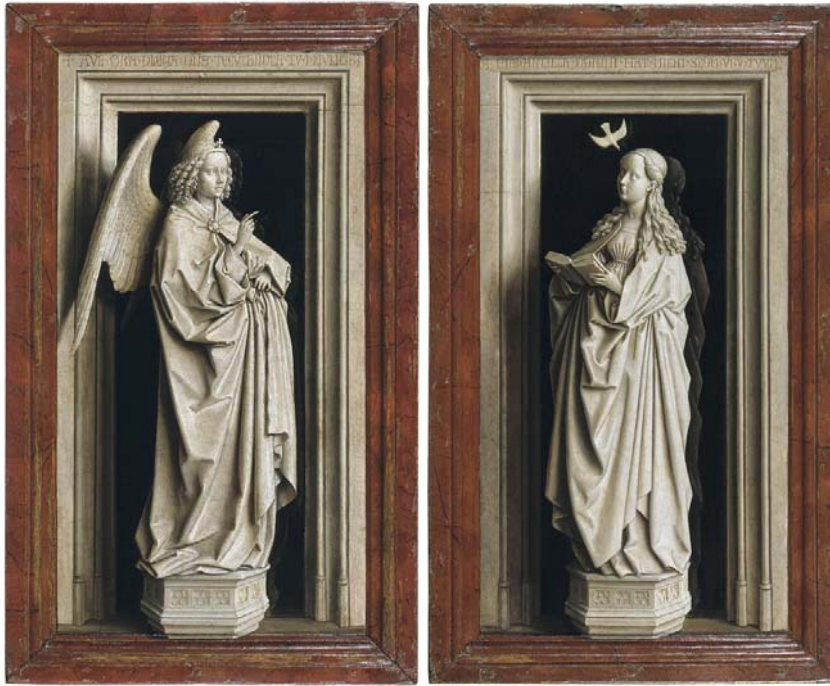
Jan Van Eyck, Díptico de la Anunciación , c. 1433-1435, óleo sobre tabla. Madrid, Museo Thyssen-Bornemisza.

http://www.museothyssen.org/img/obras_grande/1933.11.1-2.jpg [captura 10/7/2013]