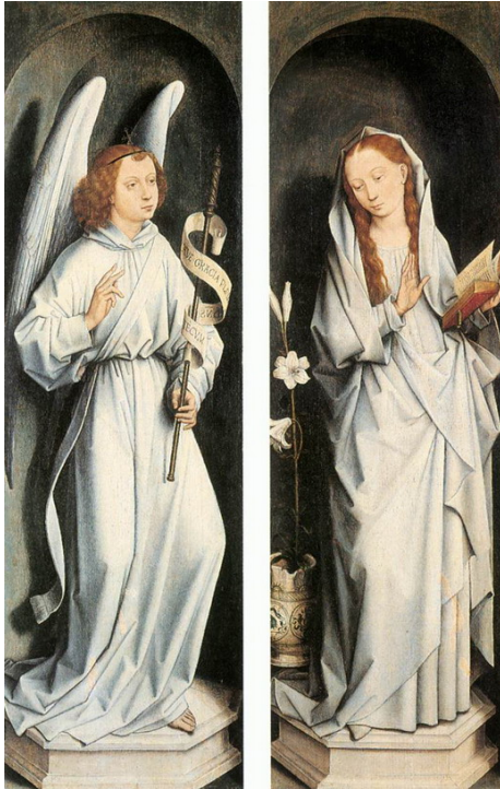
▲ Hans Memling, Díptico de la Anunciación , c. 1467-1470, óleo sobre tabla. Brujas, Groeninge Museum.

http://commons.wikimedia.org/wiki/File:Hans_Memling_-_Annunciation_-_WGA14811.jpg [captura 10/7/2013]