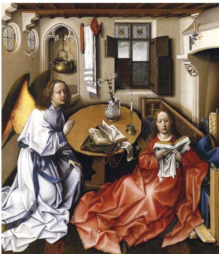
Robert Campin, Tríptico de Mérode, c. 1427-1432, óleo sobre tabla, panel central. Nueva York, The Metropolitan Museum of Art.

http://www.metmuseum.org/toah/images/hb/hb_45.76.jpg [captura 10/7/2013]